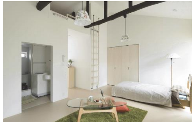
(一社)住宅リフォーム推進協議会会長賞