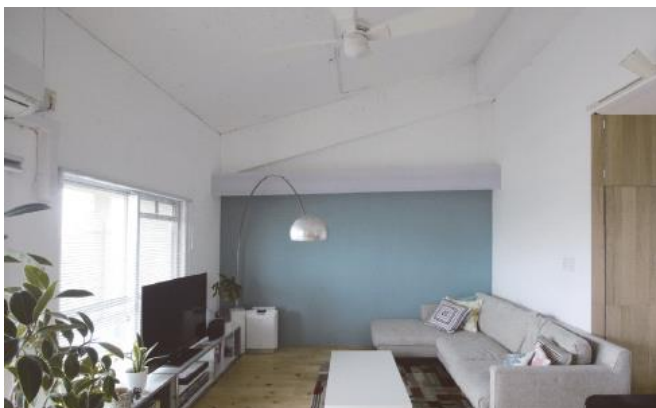
空間再編集特別賞