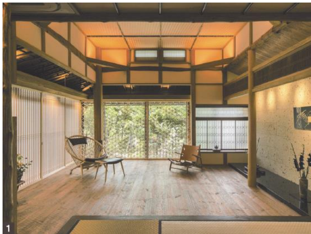
空き家再生特別賞