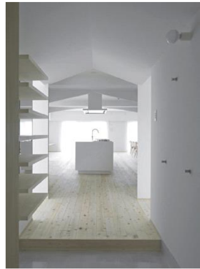
(独)住宅金融支援機構理事長賞