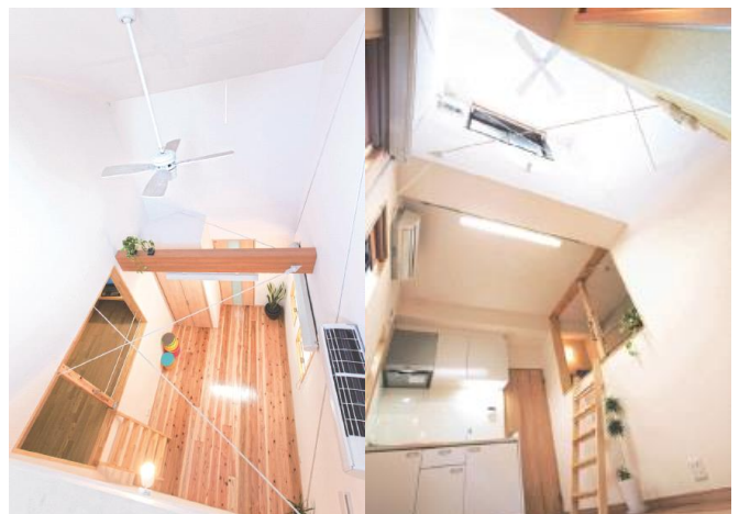
コンバージョン特別賞