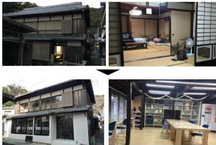
地域活性化のため空き家を地域交流施設に利活用