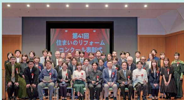
第41回住まいのリフォームコンクール入賞者の皆さん。表彰式、特別講演会・パネルディスカッションにて。