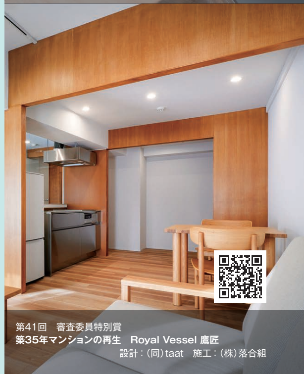
第41回 審査委員特別賞 築35年マンションの再生 Royal Vessel 鷹匠 設計:(同)taat 施工:(株)落合組