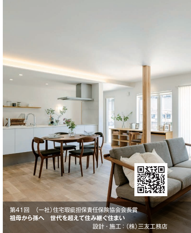
第41回 (一社)住宅瑕疵担保責任保険協会会長賞 祖母から孫へ 世代を超えて住み継ぐ住まい 設計・施工:(株)三友工務店