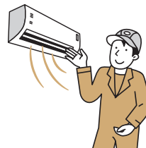
給湯器やエアコンといった設備を省エネ用の高性能なものに交換

省エネ設備の交換や建物自体の冷暖房効果を高めることで、必要なエネルギー消費を抑えることが可能です。断熱性能が高く、暖かい『省エネ住宅』は、住まい手の健康づくりにもつながります。